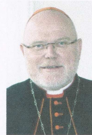
Kardinal Marx

Im 2. Buch „Jesus von Nazareth“, 7. Kapitel „Der Prozess Juesu“ schreibt Papst Benedikt XXI. über Jesus Wirken zu seiner Zeit: